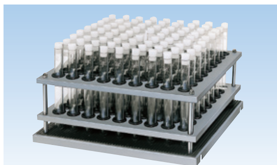
試験管振とう盤(直立型)