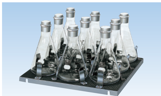
三角フラスコ振とう盤