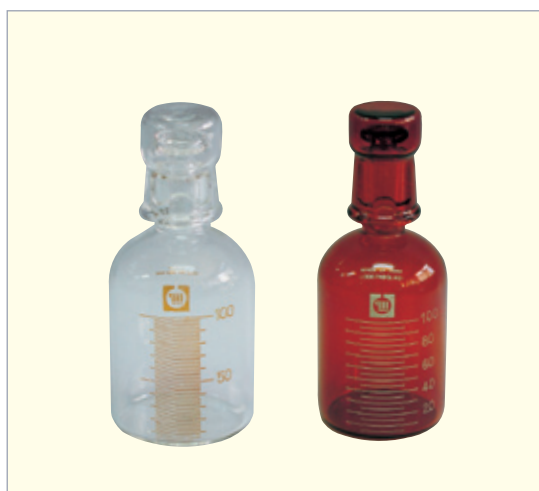
共栓付スピッツ管 目盛付(平栓付)(白色)(透明摺り合わせ)