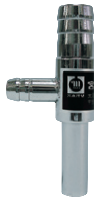
金属アスピレーター